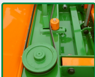
SISTEMA DE POLIAS