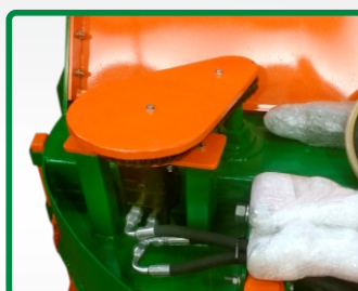
MOTOR HIDRÁULICO (opcional)