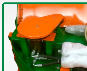
MOTOR HIDRÁULICO (opcional) 2 Motores Hidráulicos Vazão Mínima 80 Litros