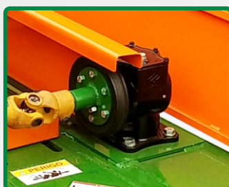
CAIXA DE TRANSMISSÃO SISTEMA DE POLIAS