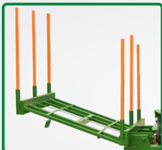
DEPOSITO DE RAMAS