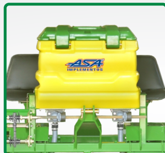
RESERVATÓRIO DE ADUBO