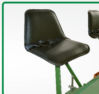
BANCO DO OPERADOR C/ (cinto de segurança)