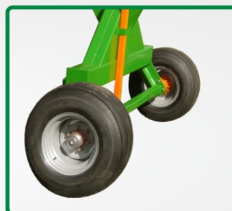
PNEU 12 LONAS