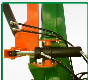
BASE GIRATÓRIA (hidráulica)