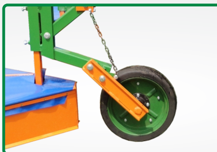
RODA LIMITADORA DE PROFUNDIDADE