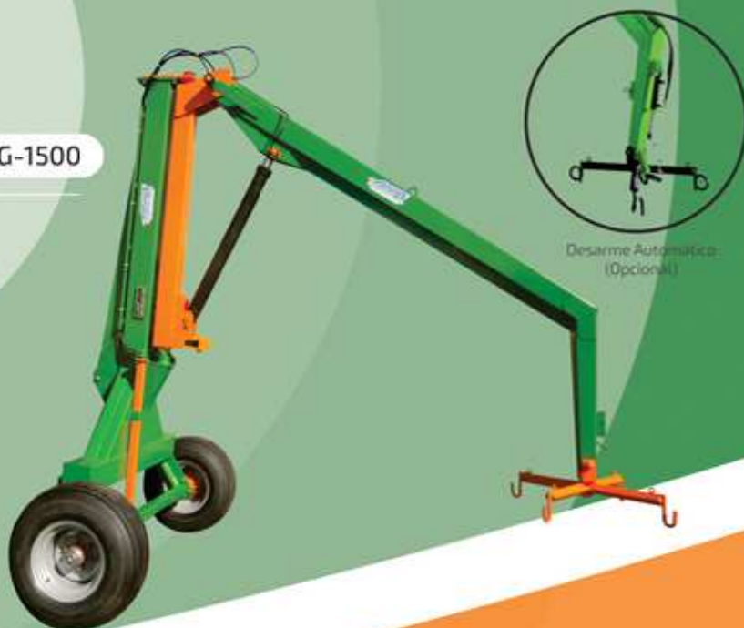
Desarme Automático (Opcional)

Elevação 6.400mm; Cruzeta e base giratória; Pneu 12 lonas; Cabeçote com lubrificação; Pistão reforçado com válvula de segurança; Desarme automático (opcional); Capacidade 1.500 kg; Potência mínima 70 hp; Peso aproximado 850 kg; Engate ao terceiro ponto do (trator).