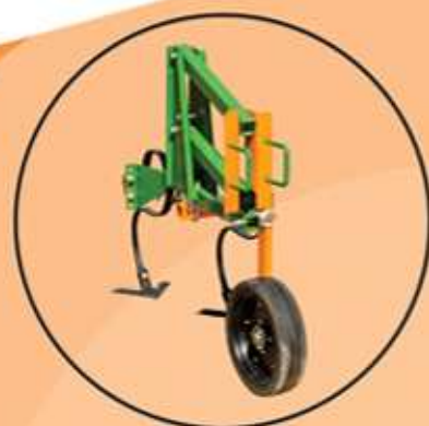
Sistema de mola 'S' (Opcional)