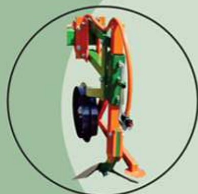
Sistema Modelo ASA (opcional) Patenteado