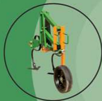
Sistema de mola 'S' (Opcional) Sistema Modelo ASA