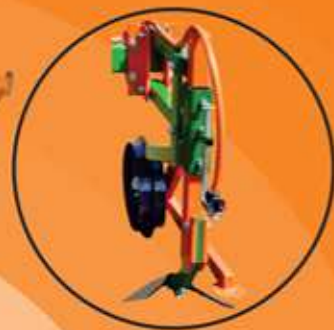
Patenteado Sistema Modelo ASA